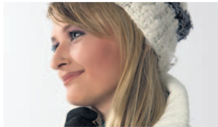
Geschützte Haut trotz Eis und Kälte.

Susanne Lamprecht, Stylistin aus Bassersdorf, www.beratung-styling.ch und www.styling4u.ch