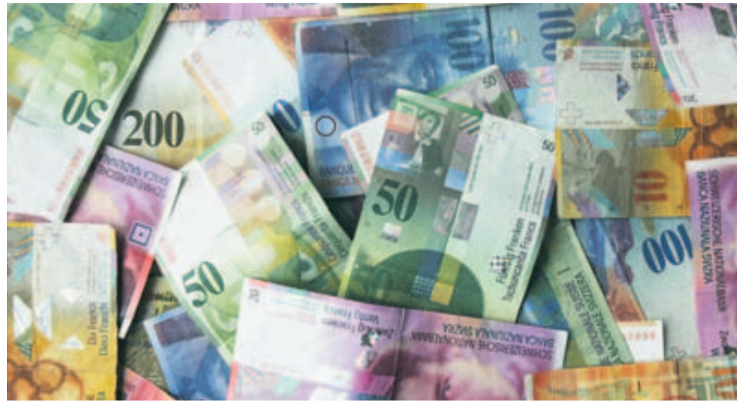
Wer sich wehrt, kann unter Umständen über die Jahre viel Geld sparen.

Rechtsberatungsstelle: Sekretariat Unia, Müsegg 3, Bülach, Di 18.30 bis 19.30 Uhr. www.mieterverband.ch/ZU