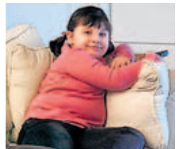
Dieses Übergewicht hat andere Ursachen.

Die Studie bringt für Gamer aber nicht nur gute Nachrichten: Sie haben im Schnitt schlechtere Schulnoten. Gerade in Mathematik schneiden sie bei Tests schlechter ab. Ausserdem sind Games nicht gut für das Selbstwertgefühl, denn sie hemmen «die Entwicklung sozialer Fertigkeiten, die für die Entwicklung einer positiven Selbstwahrnehmung nötig sind», sagen die Forscher. (pte)