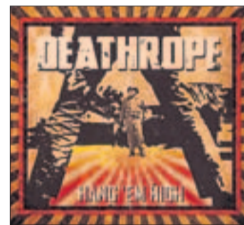
Interpret: Deathrope; Titel: Hang 'em High; Stil: Country-Rock; Vertrieb: Irascible