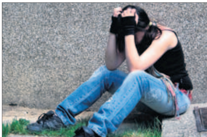
Jeder Mensch sollte Gefühle zeigen dürfen und können.

Eine andere Art besteht darin, sich von eigenen unerlaubten oder unangenehmen Gefühlen zu befreien, indem Rechtfertigungen dafür gefunden werden. So gibt zum Beispiel ein Partner dem andern etwas unvorsichtigen Partner zu verstehen: «Ich habe allen Grund, dir zu helfen, denn du befindest dich in grosser Gefahr.» Dass sich hinter seinem Angebot Eifersucht und Neid auf die Selbständigkeit des andern verbergen können, wird so nicht sichtbar. Und in der Beziehung bleiben Lücken der Kommunikation sowie Missverständnisse unaufgedeckt. So