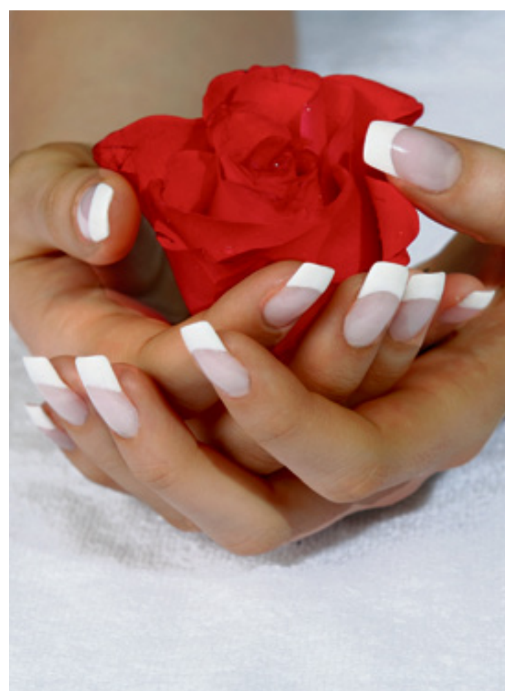
French Manicure ist aufwendig, hält aber lange, wenn man mit guten Nagellacken arbeitet.

Entscheidet man sich für eine French-Lackierung, lohnt es sich, qualitativ hochwertige Nagellacke zu wählen, damit die Farbe nicht bereits innert weniger Tage wieder abblättert. Der Aufwand ist ja nicht gerade gering – aber er lohnt sich. Eine dünne Schicht Base Coat oder Unterlack gewährleistet eine gute Verbindung zwischen Naturnagel und Farbe. Darüber wird eine ebenfalls dünne Schicht Rosé in einer Nude-Nuance aufgetragen. Danach wird die Nagelspitze wiederum dünn weiss lackiert. Hierfür eignet sich ein Ivory, welches natürlich wirkt, oder das altbekannte Schneeweiss. Damit es perfekt wird, können Schablonen aufge-