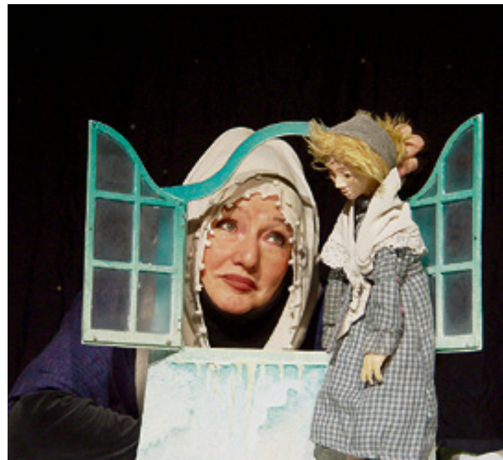
In jedem Menschen steckt ein bisschen Gold- und Pechmarie.

Mit diesem Artikel verabschieden wir uns von Ihnen, liebe Leserinnen und Leser. Es hat uns gefreut, Ihnen von unserer Arbeit und Arbeitsweise berichten zu dürfen. Wir danken Ihnen für Ihr Interesse.